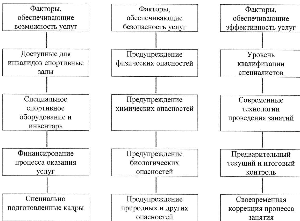
Рисунок 1. Факторы, влияющие на доступность услуг для инвалидов и других маломобильных групп населения на объектах спорта и в учреждениях и организациях, предоставляющих услуги

Понятно, что для обеспечения возможности предоставления и получения услуг для инвалидов и МГН необходимо наличие кадров, имеющих право работать с данным контингентом.